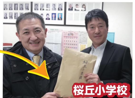
桜丘小学校・東城校長先生