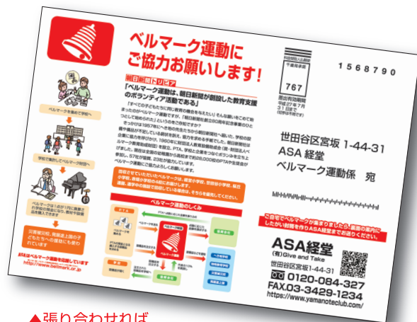
▲張り合わせれば封筒になるベルマーク回収チラシ

1月26日、読者の皆様からお預かりしたベルマーク約1年分を、経堂小学校、世田谷小学校、桜丘小学校、赤堤小学校の4校へお届けしましたことをご報告いたします。ASA 経堂は、これからもベルマーク集めボランティアを続けていきます。ご協力をよろしくお願い申し上げます。