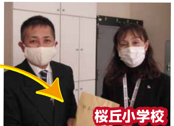
桜丘小学校・平松校長先生