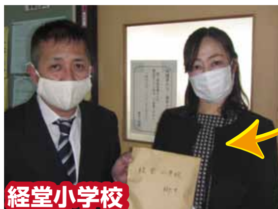
経堂小学校・遠藤副校長先生